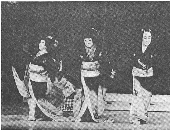
『双面』の法界坊(中央)